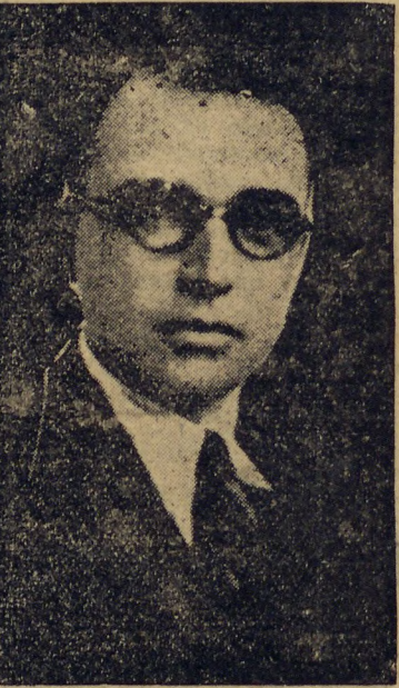
sr. Odilon Braga

BAHIA, 24 (D) — Está sendo esperado nesta capital, nestes breves dias, o sr. Odilon Braga, Ministro da Agricultura s. excia. virá em visita de cordialidade a este Estado, aproveitando o