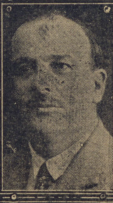
Ministro Arthur Costa

NOVA YORK, 24 (D) — Chegou hoje a esta cidade a missão financeira do Brasil, chefiada pelo ministro da Fazenda, sr. Arthur Costa.