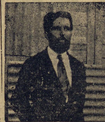
O "cavalleiro da esperança"