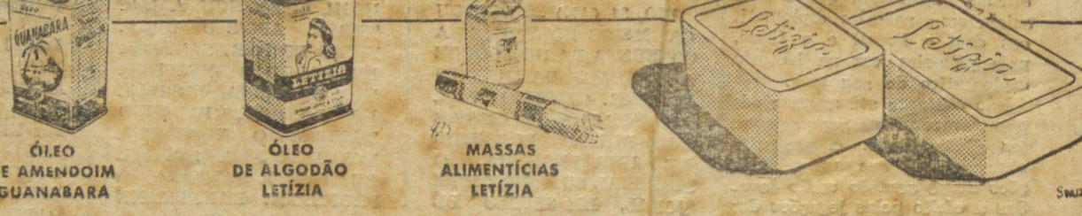
ÓLEO DE AMENDOIM GUANABARA