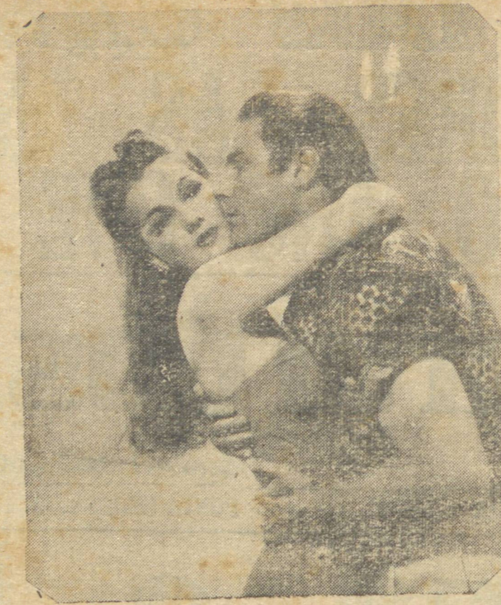
5.ª feira: Um filme espetacular!

DOMINGO EM TRES SESSÕES: a 9.30 da manhã; 2.ª a 7.15 e 3.ª a 9.15. A MULHER SERPENTE DO PARAISSO DO AMOR... EXOTICA... INSINUANTE... A MAIS NOVA SENSACAO PAU-NUM COLORIDO MARAVILHOSO! Em tra, no agua, nos tropicos... Romance, amor, deiria!