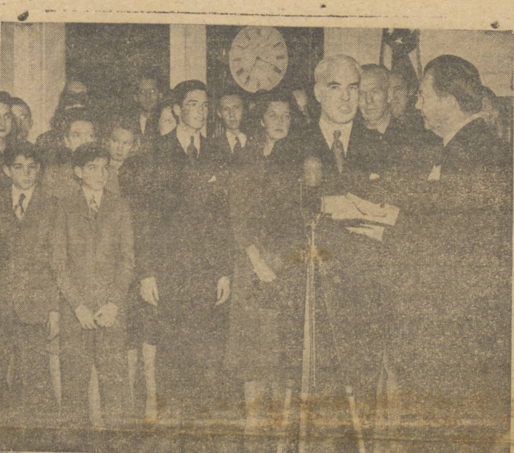
Omagistrado da Corte Suprema dos Estados Unidos, Roberto Jackson (á direita), assiste ao juramento de Edward R. Stettinius, quando este tomou posse do cargo de secretário de Estado em substituição a Cordell Halli. O secretário de Estado se acha acompanhado de sua família.