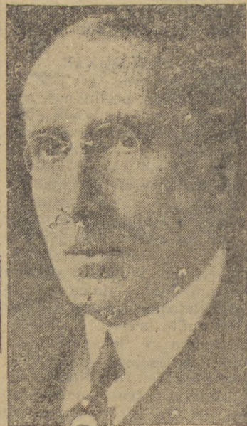
Sr. Arthur Bernardes

RIO, 19 (D) — Com a chegada ao Rio do sr. Arthur Bernardes, que veio em silencio, movimentaram-se os partidos opposicionistas, empenhados na formação do