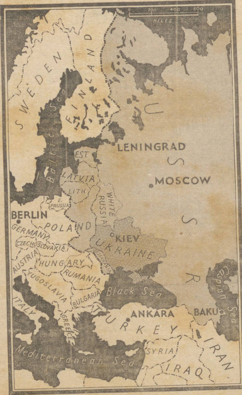
A FRENTE RUSSA