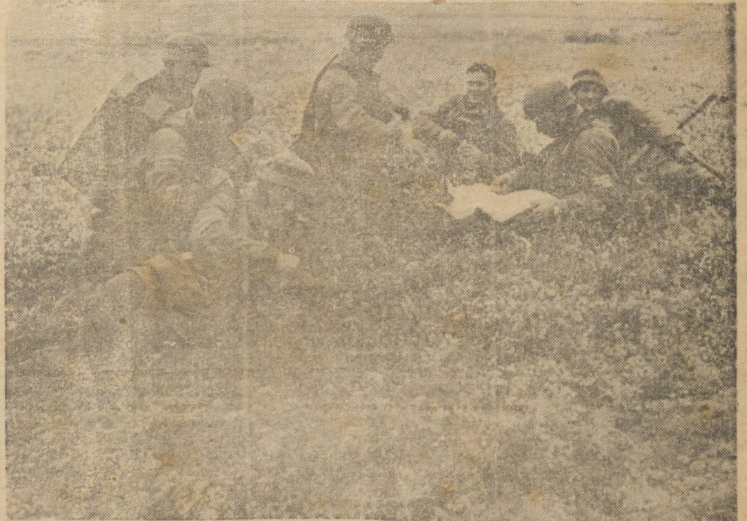
PARAQUEDISTAS ALEMÃES JA EM TERRITÓRIO DO ADVERSARIO. FAZEM UM PEQUENO DESCANSO PARA CONSULTAR O MAPA — (FOTO "TRANSOCEAN").

O correspondente do "Yomiuri" entra em considerações, concluindo no informe que o regime bolchevista não estari em condições de continuar a guerra moderna no caso de se ver obrigado a retirar-se além dos Montes Urais.