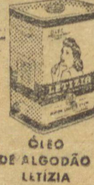
ÓLEO DE ALGODÃO LETÍZIA