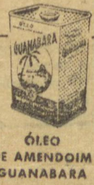
ÓLEO DE AMENDOIM GUANABARA