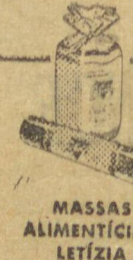
MASSAS ALIMENTÍCIAS LETÍZIA