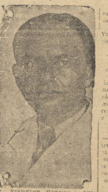
Sr. Agamenon Magalhães, que está propenso a deixar a pasta si a lei não for aprovada...