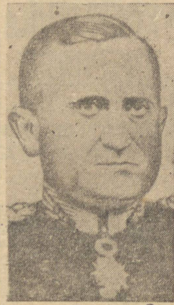
GENERAL EURICO DUTRA

RIO, 28 (P.P.) — Tendo em vista a exigência da lei ditada e como já foi divulgado, o ministro Eurico Dutra deverá deixar a pasta da Guerra, a fim de poder concorrer às próximas eleições. S. Excia., porém, não deixará o cargo a 15 de julho como foi noticiado e sim no dia 31 de agosto. O general Eurico Dutra presidirá, assim, as imponentes festividades da "Semana de Caxias". Soubemos ainda que o general Góes Monteiro, escolhido para substituí-lo, foi indicado por S. Excia. mesmo a pedido do presidente da República.