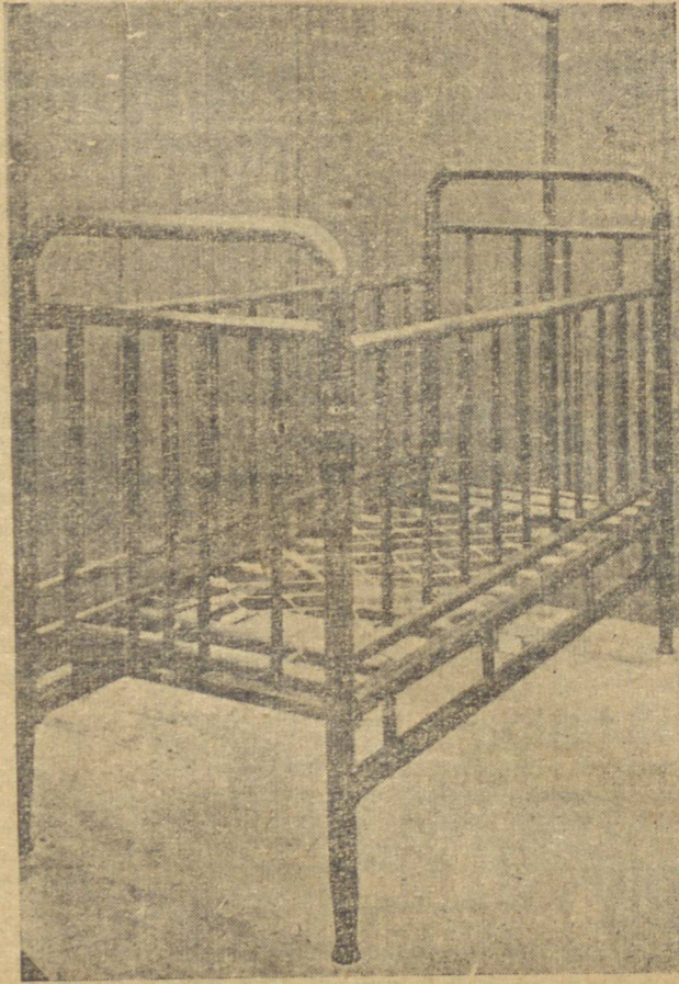
FABRICANTES DAS AFAMADAS CAMAS PROGRESSO. - RUA JULIA WANDERLEY; 1228 - FONE 273

MANTEM UM GRANDE SORTIMENTO DE CADEIRINHAS E CARRINHOS DE VIME ESMALTADO PARA CRIANÇA, BEM COMO, CONJUNTOS DE VIME FBRAX MANTEM EM ESTOQUE UM COMPLETA SORTIMENTO DE TAPETES E GONGOLEUM FABRICA E DEPOSITOS DE MOVEIS