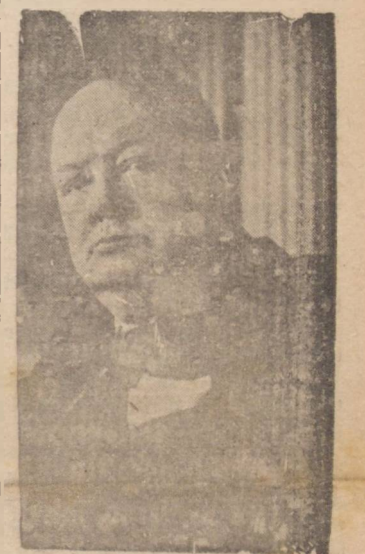
Churchill. Logo após a sua chegada, a "premier" inglês conferenciou com o presidente Roosevelt.

WASHINGTON, 11 (U. P.) — Acaba de chegar aos Estados Unidos o primeiro ministro britânico, sr. Winston