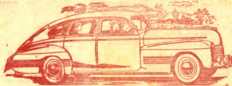
Acima ilustramos um Sport Sedan De Letz

Faça-nos uma visita. peça-nos informações. Aqui estamos para servi-lo com prazer. (Fazemos aplicações domicílio)