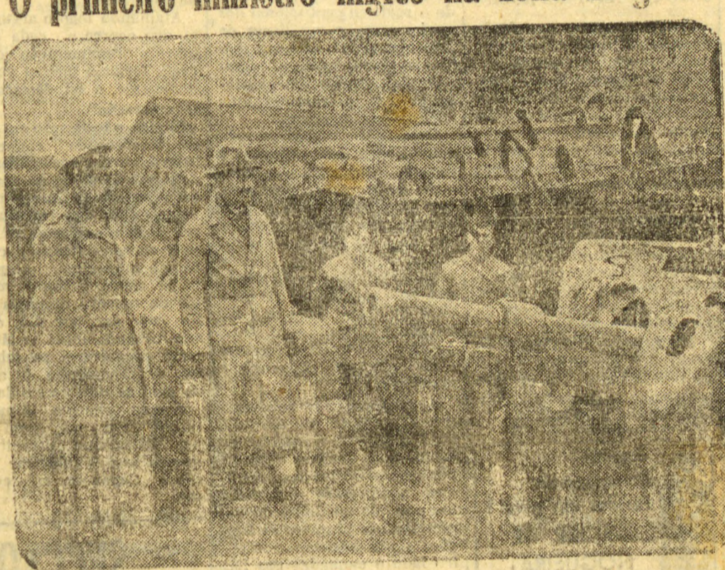
O sr. Neville Chamberlain, na França, inspecionou as tropas expedicionarias de S. M. no “front” occidental. Aqui vem-o contemplando um canhão ligeiro, “camouflado”.