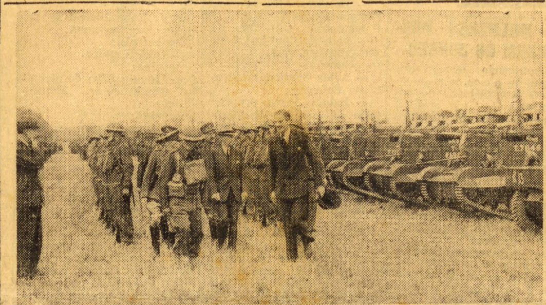
O ex-ministro da Guerra Anthony Eden, atualmente titular do Exterior britânico, e que se encontra em missão nos Balcãs, onde a Inglaterra vem de sofrer apreciação derrotada com a adesão da Bulgária ao Pacto Tripartido, inspeciona uma divisão de carros de assalto do Exército britânico de Este.