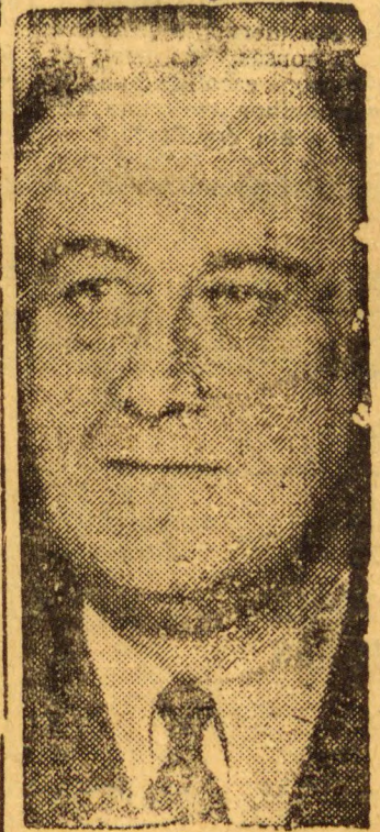
Roosevelt, Chefe do Governo norte-americano

Proseguindo disse que queria expressar a sua convicção de que os bulgaros não serão os ultimos a se unirem aos alemães. "Ao contrario, estou seguro que, com relação aos nossos fins politicos outras potencias virão a ser solidarias com a Alemanha, com a Italia e com o Japão".