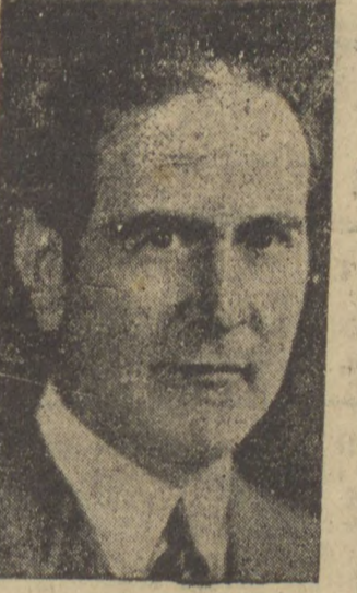
Sr. Oswaldo Aranha

A coisa por estranha que pareça tem varias proceden-