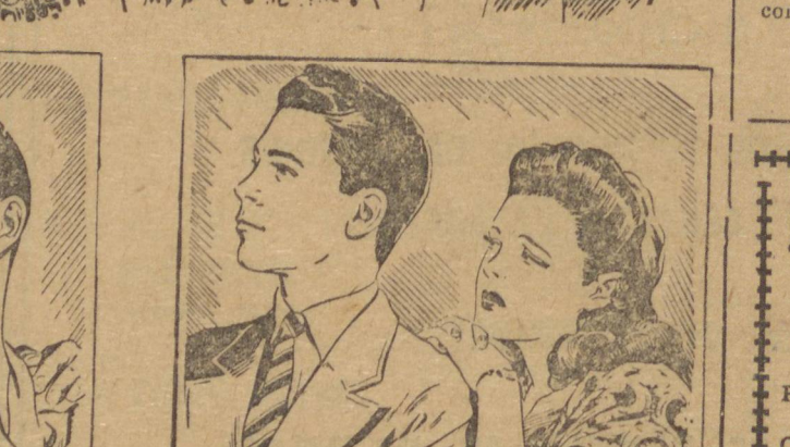
— Sim... Você é o meu tipo, não há dúvida; mas isso não se resolve assim... preciso pensar...