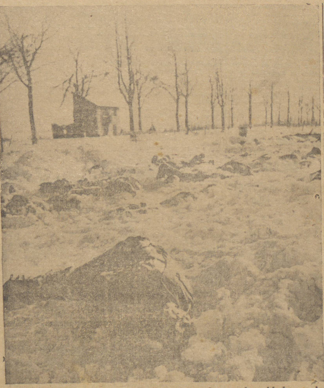
ASSASSINADOS PELOS NAZISTAS — Corpos de soldados norte-americanos sepultados na neve na frente ocidental onde foram fuzilados pelos nazistas depois de haverem vencido. Essas vítimas eram membros do Corpo Médico, da Polícia e do Exército e observadores de artilharia que esperavam ser tratados de acordo com o Código de Guerra das nações civilizadas.

RÁDIOS R.C.A. VICTOR — PHILLIPS. — MÁQUINAS DE ESCRIVER REMINGTON — COFRES E ARQUIVOS DE AÇO — NASCIMENTO — ACUMULADORES "ATLAS" DE 6, 12, 24 e 36 Volts. — COMPRA E VENDA AUTOMÓVEIS USADOS. JOÃO VARGAS DE OLIVEIRA Av. Vicente Machado, 390 — Fone 456.