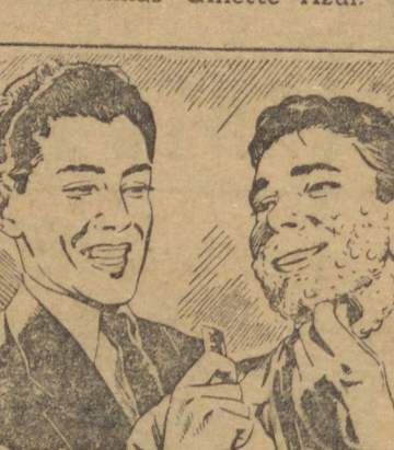
— Ficarei "abafado"? Pois váis ver como se invertem os papéis. Aposto que ela entrará os pontos!