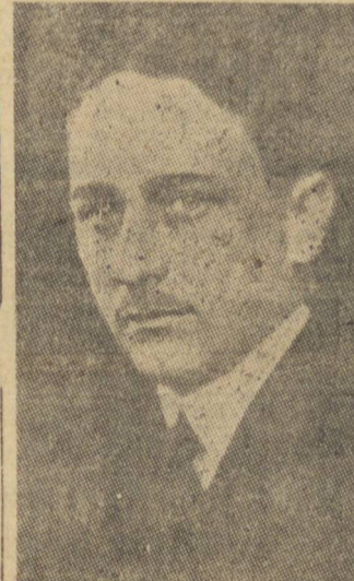
SR. MARCONDES FILHO

O orador salientou, ainda, que esse adiamento era, também, imperativo de defesa nacional, pois as agitações políticas lhe seriam prejudiciais e abririam margem à atuação da insidia de inimigos internos e externos nos jogos das paixões individuais. Destacou o ministro Marcondes