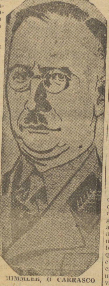
HIMMLER, O CARRASCO