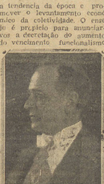
Sr. Getulio Vargas