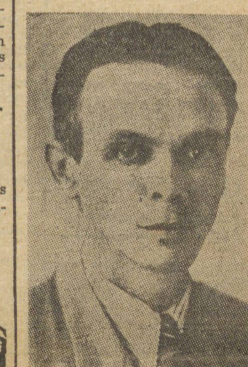
MINISTRO APOLONIO SALES