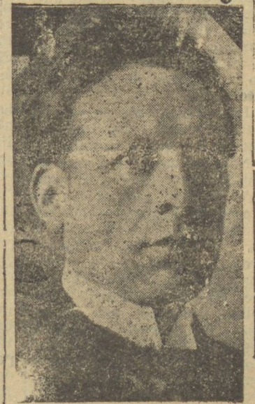
SR. FLORES DA CUNHA