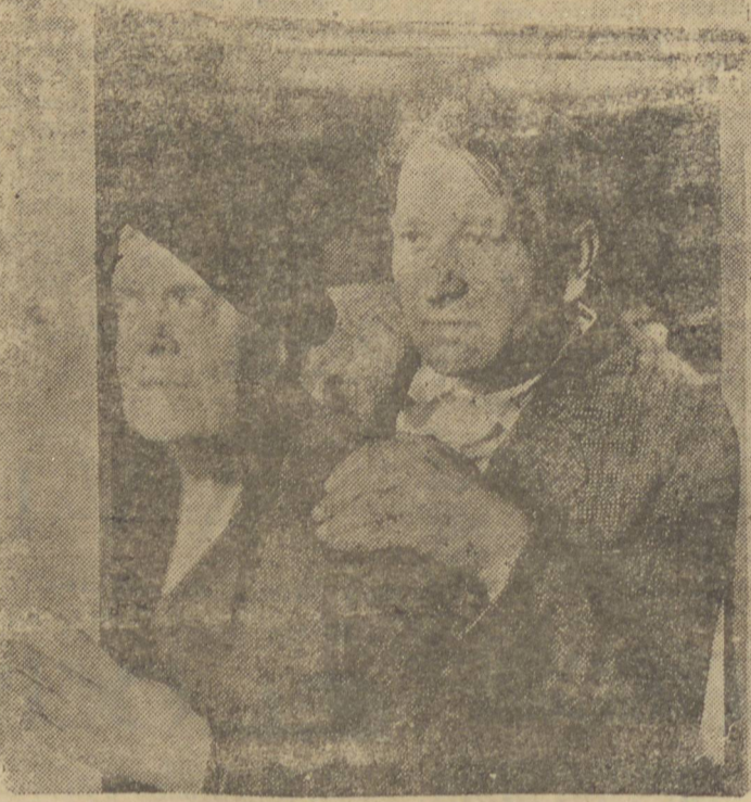
MARIE DRESSLER E WELACE BEERY, os artistas immensos que veremos domingo em «NARCISSUS» no Renca