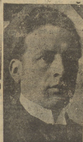
General Flores da Cunha

RIO, 24 (D) — O general Flores da Cunha, entrevistado por "A Nação", disse que recebeu um appello do sr. Getulio Vargas no sentido de insistir em exigir-lhe mais esse sacrificio, resignar-se a porque está disposto a tudo sacrificar pelo Rio Grande, o que vale dizer pela patria.