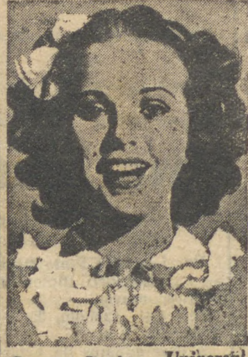
Deanna Durbin Universal

DEANNA DURBIN — a primorosa cantora que demonstrou ser no seu primeiro filme, o descobrimento mais nil e encantadora estrela cinematographica! Uma soberba produção que lhe agrada rá immensamente por seu delicioso argumento, linda musica, luxuosa representação e sobretudo, uma linda voz prodigiosa de uma juvenis sensacional no horizonte da DIANNA DURBIN.