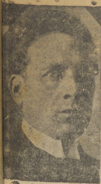
P. ALEGRE, 18 (D.) A população vinha acom-