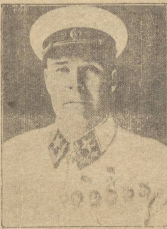
TIMOSHENKO rante as últimas 24 horas as forças russas mantiveram forças as suas posições na mar-

MOSCOU, 14 (R.) — Timoshenko — cujo nome não figurava há algum tempo no noticiário do front — acaba de abrir nova ofensiva rumo ao mar Negro. Ganhões russos estão atacando novamente o estreito de Kreech. Fuzileiros navais desembarcaram na costa. MOSCOU, 14 (R.) — Simultaneamente com o rompimento da frente alemã de Melitopol, começou nova e fortíssima ofensiva de Timoshenko, na direção do mar Negro. MOSCOU, 14 (R.) — Du-