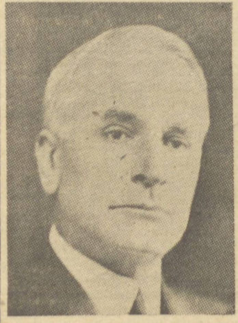
SR. CORDELL HULL

Sem dúvida, o senador Chandler se expressou com convicção e sinceridade ao