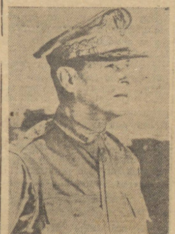
GENERAL MAC ARTHUR

Depois da operação em apreço, o general Mac Arthur