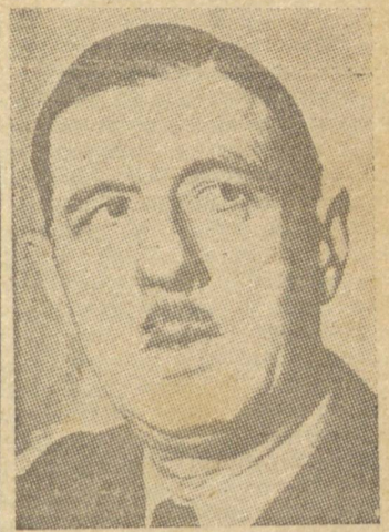
GENERAL DE GAULLE

LA LINEA, 14 (U.P.) — Chegaram ontem a Gibraltar os generais De Gaulle e Giraud, que foram alvo de honras militares. Indicam alguns rumores que os referidos mi-