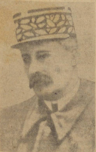
Giraud foi vítima de um desastre automobilístico na Corsega.

LONDRES, 14 (U.P.) — São contraditórias as noticias a respeito do general Giraud. Ao mesmo tempo que algumas fontes afirmam que o cabo de guerra francês chegou a Gibraltar, em companhia de De Gaulle, outras anunciam que