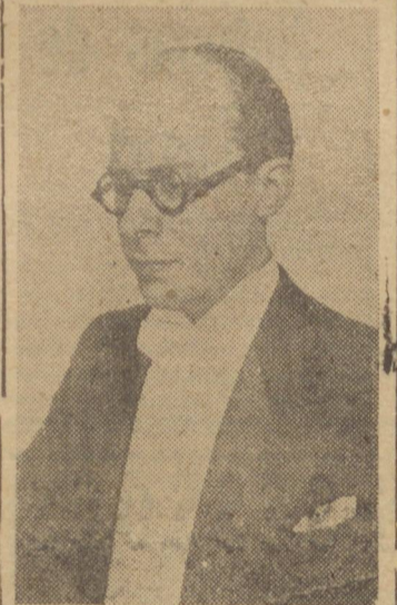
MINISTRO GUSTAVO CAPANEMA

CURITIBA, 14 (A. N.) — Em companhia do Interventor Manuel Ribas, o Ministro Gustavo Capanema visitou os estabelecimentos de ensino