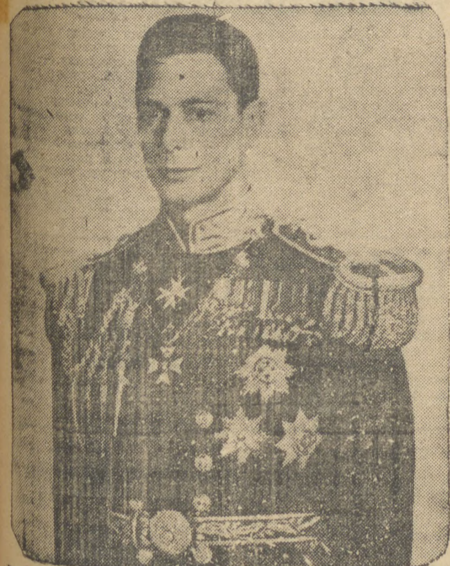
Jorge VI, sob cujas mãos o Imperio Britânico oscila em suas bases. Já Nostradamus dizia, ha alguns seculos, que a Inglaterra estafecar-se-ia sob a regencia de um "VI" qualquer... Hoje pesa sobre os ombros de Jorge VI a maior responsabilidade já experimentada por um rei inglês. A historia se repete

Concluíram-Se As Negociações A Uma Hora Da Manhã -- Hitler Foi Cientificado Alta Madrugada