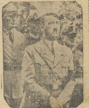
HITLER, CHANCELER DO REICH

ticia da conclusão do Pacto de Não-Agressão germano-sovietico chegou á esta capital depois que os jornais já haviam entrado no prelo. Imediatamente foram impressas edições especiais, dando o texto integral do pacto e publicando-o com o maior destaque, na primeira pagina, sob cabeçalhos que fazem ressaltar a imensa importancia deste sensacional acontecimento politico. Os meios politicos dão vasa ao jubilo de que estão possuidos pela feliz conclusão das negociações germano-sovieticas. ROMA, 24 (D.) — Anuncia-se que a Italia assinará, também, um pacto de não agressão com a Russia, para o que irá a Moscou o Conde Ciano.