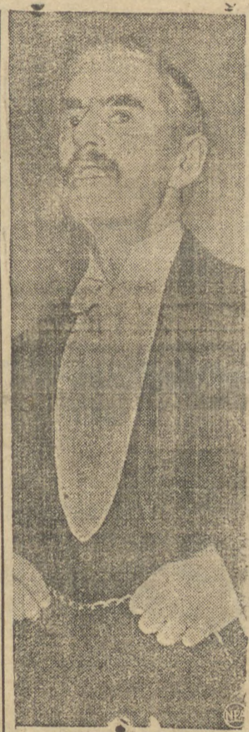
Chamberlain, chefe do governo britânico, que acaba de sofrer grande derrota no quadro da politica internacional

O CONSELHO DE MINISTROS DECIU QUE O ANUNCIADO "PACTO DE NÃO-AGRESSÃO" GERMANO-SOVIETICO NÃO VIRA' DE FORMA ALGUMA REFLETIR SOBRE OS COMPROMISSOS PUBLICAMENTE ASSUMIDOS PELA GRã BREITANHA, E QUE O GOVERNO INGLEZ ESTAVA PRONTO A MANTELOS E CUMPRÍ-LOS ATÉ AS SUAS MAIS EXTREMAS CONSEQUENCIAS.