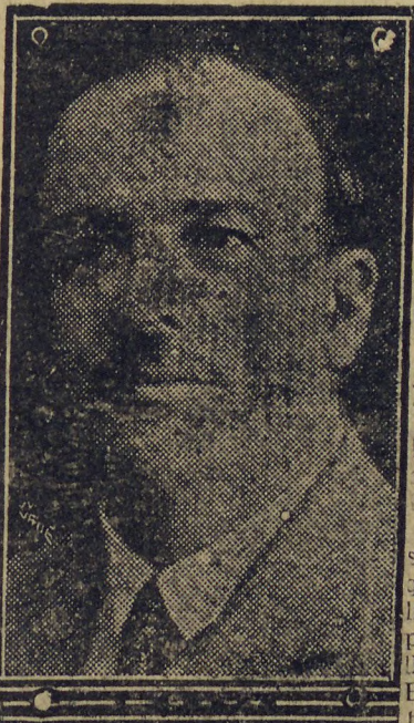
Ministro Arthur Costa

WASHINGTON, 31 (D) — As conversações da missão brasileira tiveram inicio sob