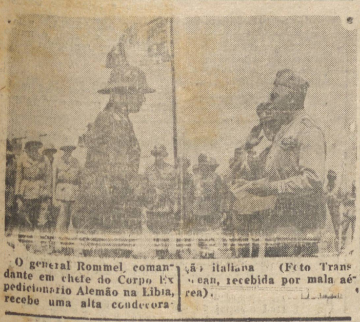
O general Rommel, comandante em chefe do Corpo Expedicionário Alemão na Líbia, recebe uma alta condecoração.

LONDRES, 22 (Reuters) — A criação de uma frente ocidental seria uma loucura, declarou Lord Moyne, líder da Câmara dos Lords, respondendo a uma crítica de Lord Strachey sobre a impossibilidade da Inglaterra de oferecer uma ajuda maior à Rússia. Proclamou Strachey: — Esta é a hora da nossa maior humilhação. Referiu-se a seguir às infortunações de fonte americana de que os alemães possuem apenas 25 divisões para fazer face a uma 2ª linha de batalha no ocidente e menos de 300 tanks. Lord Moyne comentando a questão da distribuição da produção humana para uma exigência de guerra, disse que embora as nossas forças armadas no próximo ano sejam iguais às que possua o inimigo no fim da guerra passada, nossas cifras para a produção de munição, estarão duplicadas. Por fim sugeriu um maior esforço afim de que as mulheres participem mais na tarefa do esforço de guerra.