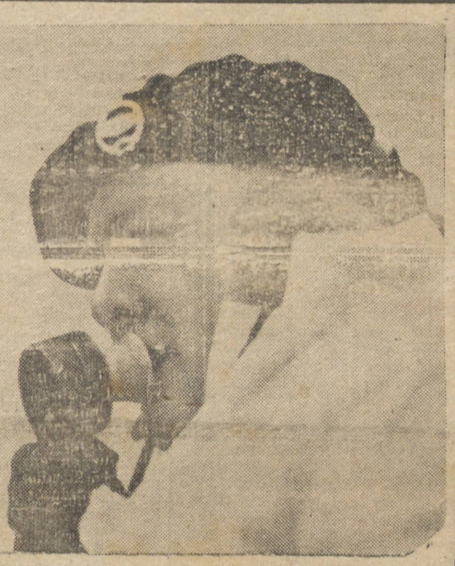
Virginio Gayda escreve sobre a luta na frente oriental.

enormes. Acrescentou a informação: "Na região de Tangarob, o inimigo intensidade, a situação é extremamente grave e grandes reforços de defesa podem conter o inimigo". Anunciou o boletim que no decorrer de 5 dias as perdas alemãs foram de 5.000 homens, entre mortos e feridos, num setor do front em direção ao sudoeste. No mesmo setor, 2.500 soldados nazistas foram aniquilados.