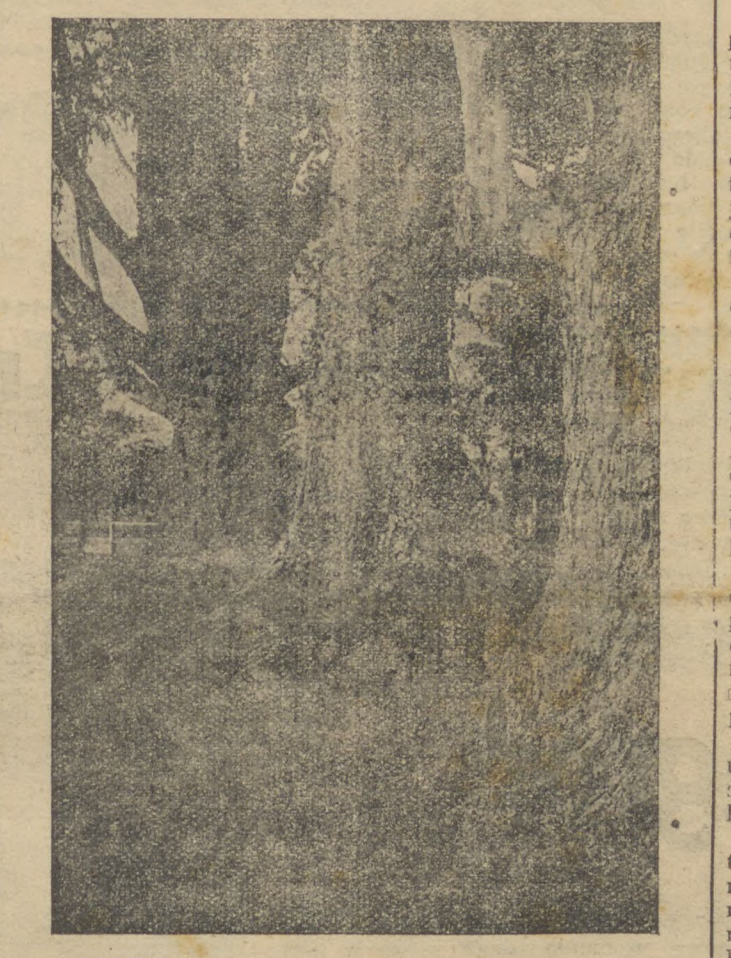
A ALMA VERDE DAS FLORESTAS

O GOVERNO VAE FISCALIZAR RIGOROSAMENTE O REFLORESTAMENTO DAS ZONAS DESMATTADAS