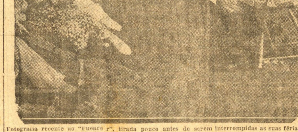
Fotografia recente do "Fuehrer", tirada pouco antes de serem interrompidas as suas férias

LONDRES, 16 (S. P., agência inglesa) — Segundo notícias procedentes da Belgica, depois de um período de grande nervosismo naquele país, devido à concentração de tropas alemãs na fronteira da Belgica e da Holanda, a calma voltou a toda a população, parecendo fracassada a tentativa do Reich de estabelecer uma guerra de nervos naquelas duas nações. Aliás, de aia chegam notícias segundo as quais o governo holandês não estava levando muito a serio o movimento de tropas germanicas.