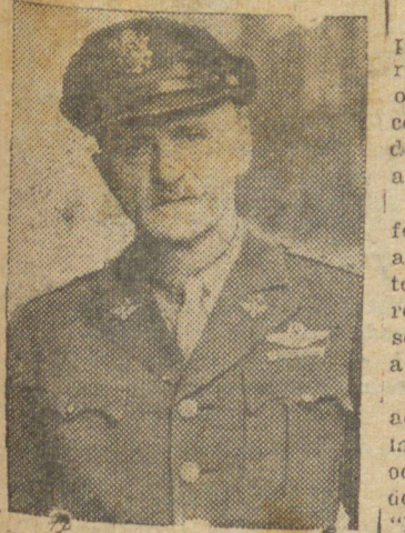
Carl Spaatz, comandante das Forças Aéreas dos EE. UU.

LONDRES, 11 (U.P.) — O general Spaatz, comandante em chefe das Forças Aéreas