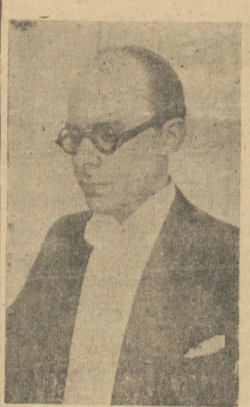
MINISTRO GUSTAVO CAPANEMA

realizou-se ontem demorada reunião de professores