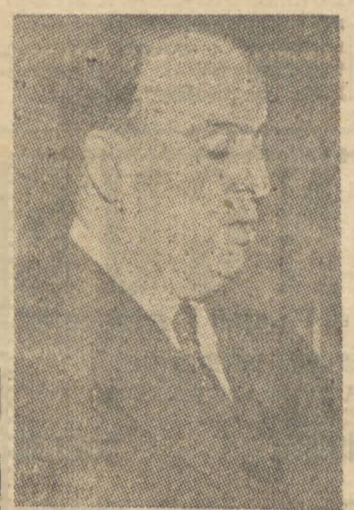
Ministro Souza Costa

A ida do Ministro Souza Costa a São Paulo — S. PAULO, 29 (A. N.) — Aprecie-se sua estadia em São Paulo, onde chegará no próximo dia 3 de Novembro o Ministro Souza Costa fará entrega simbólica do prédio que estão instaladas a Delegacia Fiscal de São Paulo e Prefeitura local. A medida