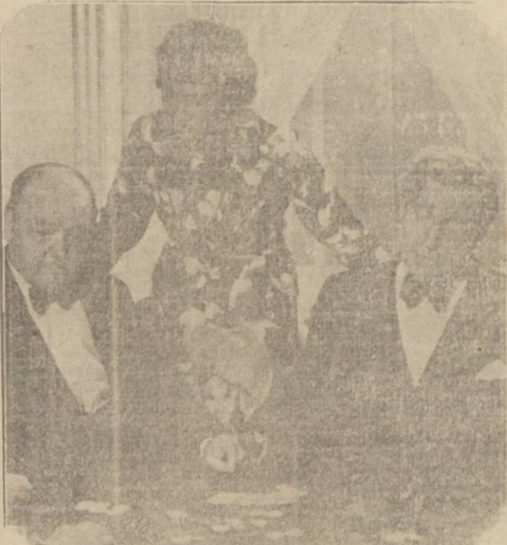
SACHA GUITRY, como principal protagonista de um romance que satisfaz ao mais exigente espectador!

Uma historia comovedora, imponente e fina, apresentada pela ART FILMS.