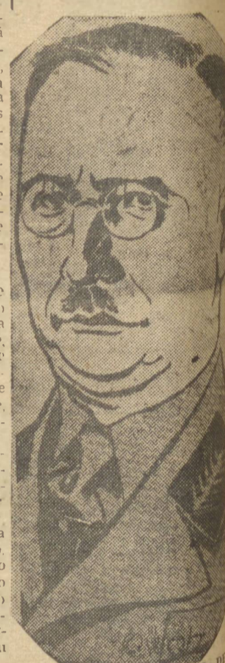
HITLER, O CARRASCO DA POLONIA

LONDRES, 6 (PAT) — O Governo Polonês recebeu dia 17 de outubro, dos representantes na Polónia, relatório alarmante sobre a situação em Varsovia no dia 3 do mês de outubro. Segundo a fonte informativa, por um de uma semana perdurou o cerco da cidade polonesa e o terror imposto pela Gestapo (exército, como pelas tropas de SS. O objetivo desta operação de terror, era de recrutar cidadãos para os trabalhos forçados no Reich, e a incapacidade de 100 por cento de sua população para os trabalhos empreendedidos, vez que sua moral baixa por dia devido aos constantes e formidáveis bombardeios aliados. Muitos foram mortos e feridos, não só os homens, com também as pobres mulheres, crianças e enfeitos. Devido a crescente onda de subjugação levada a efeito contra o invasor inimigo vem de adotar medidas as mais severas possíveis contra os elementos da população civil.