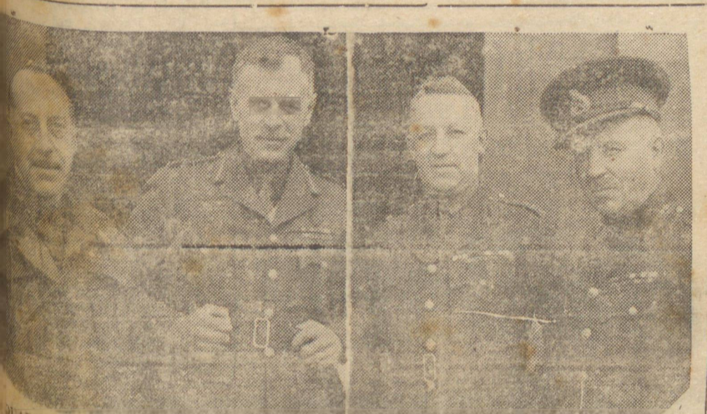
QUARTEL GENERAL DO PRIMEIRO EXERCITO CANADENSE PRESENTEMENTE ESTABELECIDO NA INGLETERRA — Esta fotografia recente, tomada em Londres, mostra (da esquerda para a direita) tenente-general H. S. G. Crear, D.S.O., o tenente-general B. G. L. Mc Noughton, major-general G. E. Turner, M.C., D.S.M., e o major-general P. L. Montague, C.M.C., D.S.C., C.V.D., todos do quartel general canadense.

O primeiro exercito canadense ultra-marino será uma força moderna bem treinada e composta de excelentes combatentes, capaz de operações em qualquer teatro de guerra. Esse exercito destaca-se pelo seu poderio em torças blindadas.