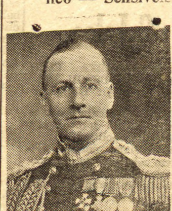
O vice-almirante sir James S. Somerville, K. C. B., D. S. O. Ingressou na Marinha aos 15 anos de idade. Na ultima guerra foi-lhe conferida a distinção D.S.O. por seus feitos nos Dardanelos. Desde então tem se destacado no controle do Mediterraneo pela Esquadra Inglesa

"A pequena, mas valente esquadra grega" tomou parte ativa na batalha do Mediterraneo — Sensíveis perdas italianas