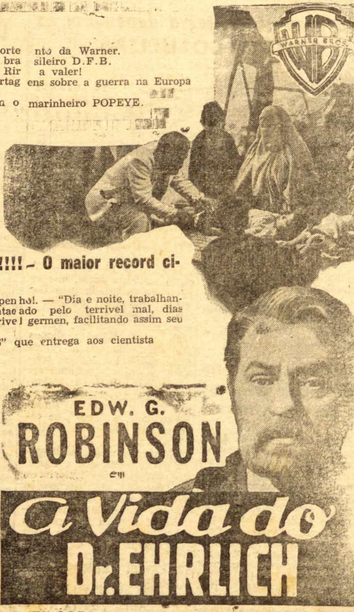
RUTH GORDON OTTO KRUEGER DONALD CRISP

AVISO: — As entradas continuam, durante todo o dia, à venda na Bilheteria do Cinema.