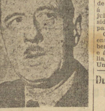
GENERAL DE GAULLE

WASHINGTON, 28 (U. P.) — Falando aos jornalistas, o