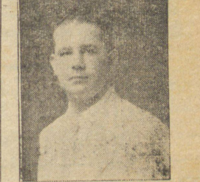
Sr. CONSTATE GRANDE socio gerente da importante organização comercial.

Tem sabido, com o seu labor honesto, se impor como acreditado negociante, sendo promissora a marcha de suas atividades.