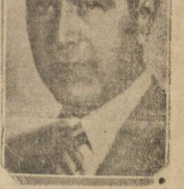
Ministro Oswaldo Aranha

RIO 26 (A. N.) — Informam de Santiago, oficialmente, que o ministro Oswaldo Aranha visitará brevemente o Chile, na primeira quinzena de Outubro proximo, como convidado do governo daquele país.