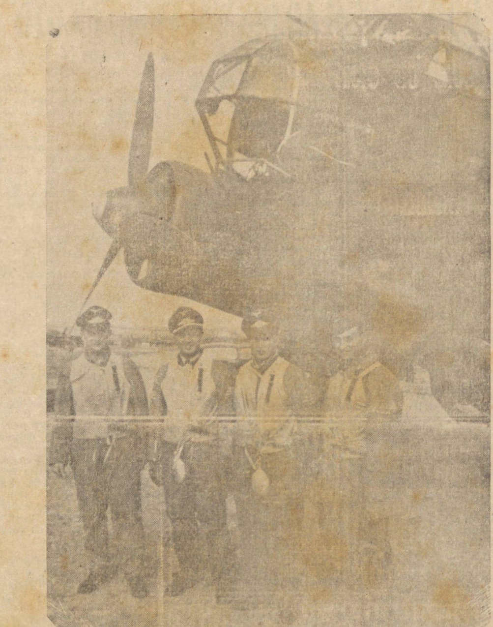
AVIADORES DA "LUFTWAFFE", FOTOGRAFADOS DIANTE DE UM BOMBARDEIRO BI-MOTOR APÓS FELIZ EXCURSAO AO TERRITORIO DO ADVERSARIO.

MOSCOU, 26 (Reuter) — Segundo a emissora desta capital, os grupos de guerrilheiros soviéticos operam ao longo das margens do Dnieper e escolheram as unidades motorizadas alemãs como presa principal, tendo adquirido a técnica eficaz de destruí-los. No decorrer dos ultimos dez dias um unico destacamento com garrações de petróleo des truiu 5 tanks e um carro blindado inimigos. Salienta a informação que numa determinada ocasião, 13 carros de tração, e dois condutores de petróleo foram destruidos quando rebotaram as minas na estrada por onde passavam. Quinze soldados nazistas morreram e varios tanks que esperavam abastecimento foram incendiados. Doze pontos sobre o rio Desna e seus afluentes foram destruidos num periodo de poucos dias como resultado da ação das guerrilhas.