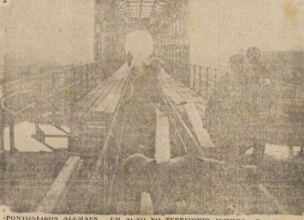
PONTONEIROS ALEMAES EM AÇÃO NO TERRITORIO INIMIGO.

MOSCOU, 26 (Reuter) — De acordo com as ultimas informações procedentes de Leningrado, a batalha pela posse da cidade continua com a violencia de sempre. Após a tomada de Kiev, os alemães voltaram a ser o alvo de maior interesse. É impossível falar de uma intensificação da batalha nos ultimos dias, porque os alemães haviam acumulado tantas divisões e grande quantidade de material na frente tão pequena que agora estão concentrando todos os seus esforços, quasi num unico ponto, para tentar abrir caminho em direção a Leningrado e através das linhas de defesa.