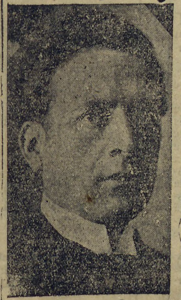
GEN. FLORES DA CUNHA

RIO, 9 (D) — O general Flores da Cunha, interventor federal no Rio Grande do Sul, que ainda se encontra nesta capital, concedeu