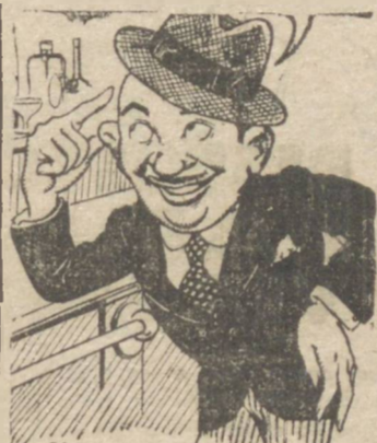
O "crack" gordo Laur, Ferreira em conjecturas no balcão do Bar Daninha