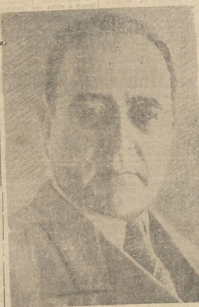
SR. GETULIO VARGAS