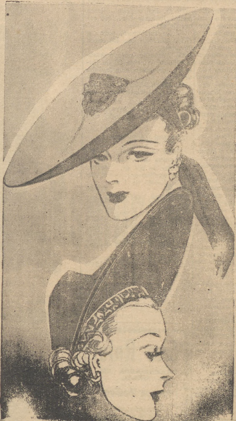
Dois modelos de chapéu, usados largamente em Paris, no verão atual. Como se sabe, lá é verão, no momento. De man eira que, quando chegar o NOSSO verão, esses chapéus serão a ultima palavra...

sei que não. Pois dentro de alguns dia estaremos vivendo juntos, eu e ele... Só se viram novamente dois anos depois. Ela não apresentava, como nos tempos antigos, um sorriso nos labios. Estava palida, triste e carregava uma criancinha. — O! ha quanto tempo!... — O tempo suficiente para aprender... - disse-lhe ela. E mudando imediatamente de assunto: — Você não mudou. — Não, mas você... Digame, como vai a felicidade? Ela tentou um sorriso, mas não era mais igual áqueles de outros tempos. Respondeu: — Durou três meses. Ele... E pôs-se a chorar. A chorar e a falar: — Três meses... tres meses... Também... por um tostão... foi bastante tempo, não foi?... RIBEIRO PENA