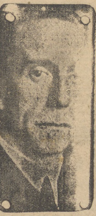
O DR. GOEBBELS

Goebbels falou na praça publica — "Queremos voltar ao Reich!", gritava o povo alemão