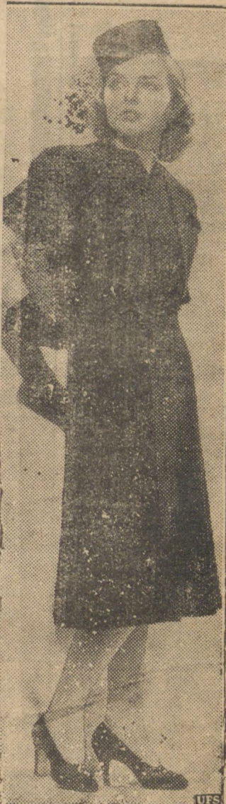
Vestido de lã, com bolero recortado. A blusa é em seda, de cor, fazendo contraste.

(Antiga Casa Paris) DE Israel Averbach Grande sortimento de Roupas Feitas, Calçados, Chapéus, Armarios e Moveis Calçados para senhoras, par 15$000 GRANDE SORTIMENTO) FORMIDAVEL "QUEIMA" Rua Coronel Claudio, 11 PONTA GROSSA E. DO PARANA'