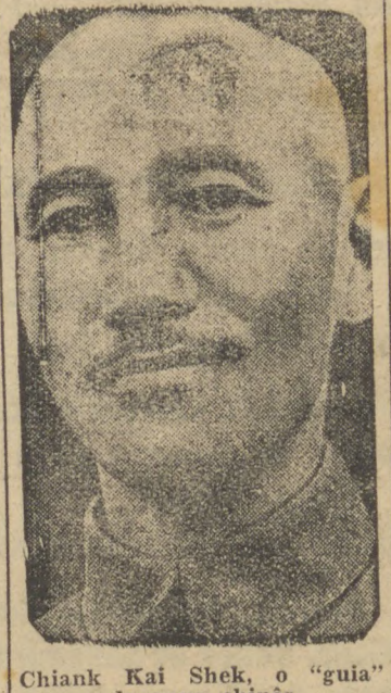
Chiank Kai Shek, o "guia" do povo chinês

Por esta razão não é verdade que o embaixador britânico intentou conversações de paz com as autoridades chinesas ultimamente ou que as es-