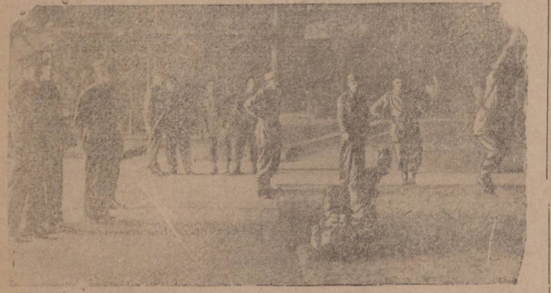
OS CHEFES DO EXERCITO E DA FORÇA AEREA BRITANICA OBSERVAM OS PARAQUEDISTAS EM EXERCICIO — O general Sir Bernard Paget, comandante em chefe britânico das forças terrestres e o Marechal do Ar, Sir Arthur Barratt, comandante em chefe do exercito de cooperacao britânico visitaram uma base de treinamento de tropas paraquedistas na Inglaterra. Observaram as primeiras lições sob a orientação dos peritos instrutores da R.A.F. Foi encerrada uma descida em massa de tropas. Vemos na fotografia o Marechal do Ar, Barratt, e o general Sir Bernard Paget com os instrutores da R.A.F., observando os exercicios dos paraquedistas.

americanas e francesas acionam contra o flanco das forças de von Rommel, tentando cercá-las e destruí-las. Acreditase que Rommel tentará retirar-se novamente no terreno escarpado, situado ao norte de Gabes a fim de deter o fortíssimo avanço do 8.º Exército Imperial Britânico. Outros despachos acrescentam que a "Luftwaffe" está tentando proteger a retirada nazi-fascista. No entanto, os totalitários não tiveram êxito, perdendo 31 aviões, sóm jnto na jornada passada. No mesmo período, as perdas aliadas foram de 12 méquinis. Os aliados, por sua vez, admitem que Rommel conseguiu atravessar o estreito de Chott-Djerid e o golfo de Gabes escapando a ação de envolvimento posta em pratica pelos soldados aliados. Em vista disso, o "Afrika Korps" poderá reunir-se, em sua maior parte, às forças do general von Arnim, resultando daí a constituição de um novo exército no norte de Tunisia.