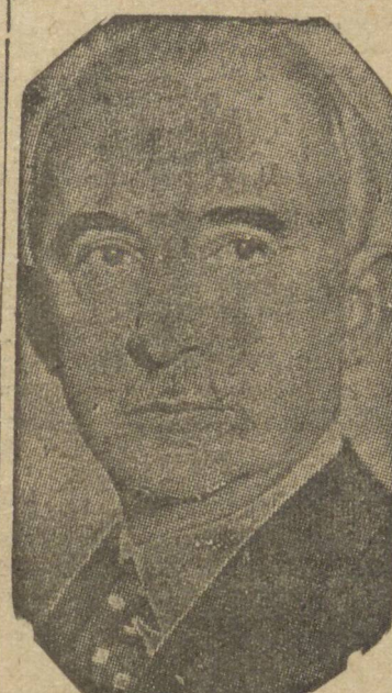
Sr. Inoni, presidente da da Turquia

WASHINGTON, 3 (U.P.) — A Turquia poderá perder os benefícios da Lei de Empréstimo e Arrendamento norte americano, se for confirmada oficialmente a suspensão de fornecimentos de guerra e de petroleo britânicos ao governo turco. Essa informação foi prestada por pessoa bem informada e ligada ao Departamento de Estado norte americano.