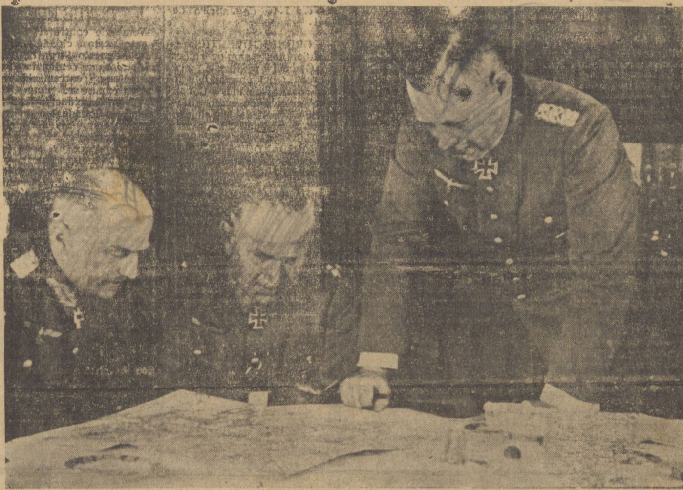
Altas patentes alemãs, sobre um mapa da Europa, traçam planos. No centro, o gal. von Keitel, chefe do exercito teuto

BERLIM, 26 (A. N.) — As esferas autorizadas mantêm-se em completo silencio, sobre as noticias que dizem respeito a Budapest, Berna, Belgrado e outras capitais neutras, momentaneamente no tocante a movimento de tropas alemãs. Ao responder ás perguntas de correspondentes estrangeiros sobre o que havia de certo nos movimentos de tropas que atravessavam a Hungria, em direção da Rumania, do envio de tropas á Italia e movimentos de tropas na fronteira russa, respondeu o inter-