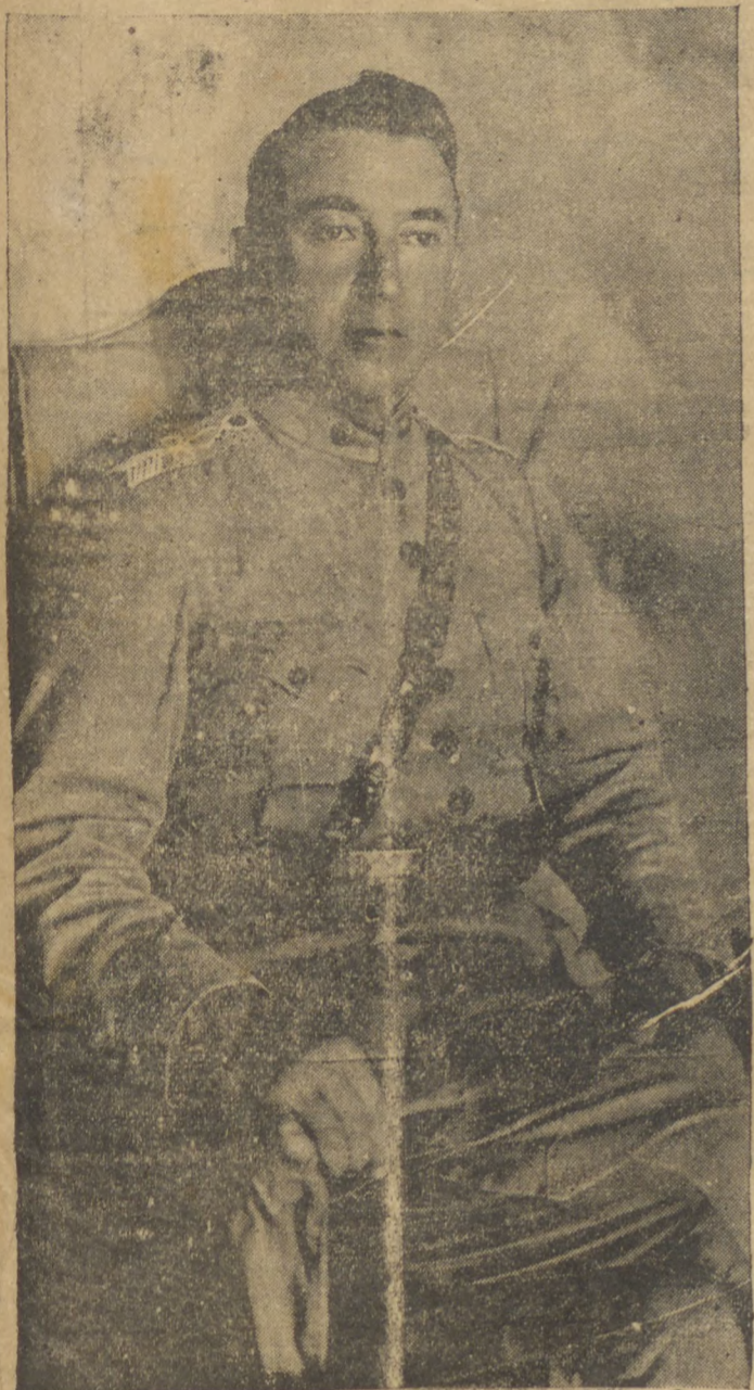
Cel. AYRTON PLAISANT

Segundo informações colhidas pela nossa reportagem, o sr. ministro da Guerra determinou a prisão do cel. Ayrton Plaisant, em face de suas actividades políticas em nosso Estado, que estavam ultrapassando os limites determinados pelas leis vigentes. O cel. Plaisant, com efeito, estava ou dizia estar conspirando contra os governos constituídos. Anunciou para 3 de outubro último um sublevação da ordem, com in-