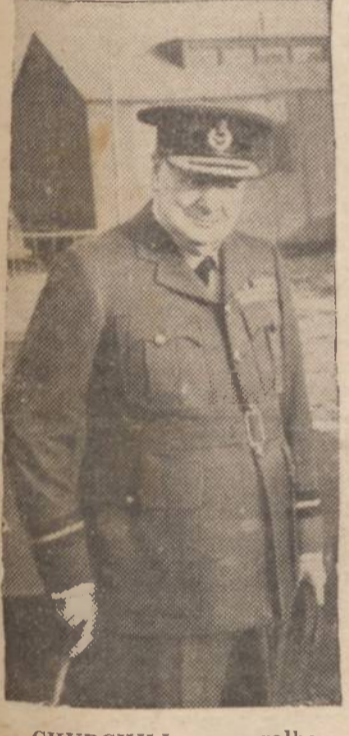
CHURCHILL, a muralha da Democracia