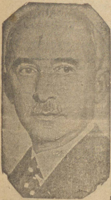
ISMET INONU RACHA, chefe do governo turco