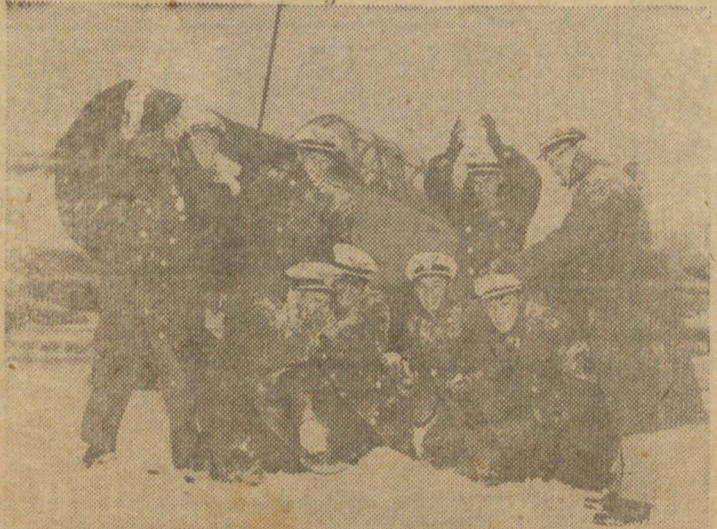
Cadetes brasileiros que se encontram em treinamento nos Estados Unidos, num momento de folga, divertem-se no aeródromo todo coberto de neve.