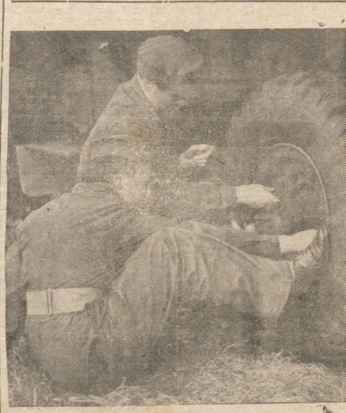
MOCAS INGLESAS SERVINDO DE "CHAUFFEURS" E MENSAGEIRAS. — Os Serviços Auxiliares Territoriais Femininos têm grande necessidade de "chauffeurs" competentes, para o que lançou um novo método de recrutamento, empregando nestes Serviços homens de constituição robusta, uma vez que têm necessidade de dirigir os comboios, as ambulancias militares, os carros do Estado Maior e os caminhões. Enquanto para ser mensageira torna-se mister possuir espirito de iniciativa e coragem. A foto acima nos mostra duas mocas desses Serviços Auxiliares mudando as rodas de um pesado caminhão enquanto treinavam para dirigir ambulancias militares.

Existem ali verdadeiras aldeias japonesas! RIO, 2 (Do correspondente especial) — "O Globo" publica especial correspondência de São Paulo, declarando que existem verdadeiras aldeias japonesas dentro de São Paulo, apresentando: "Existem atualmente em São Paulo, cerca de 20 mil japoneses, não se observando, porém, a sua disseminação, como ocorre com os