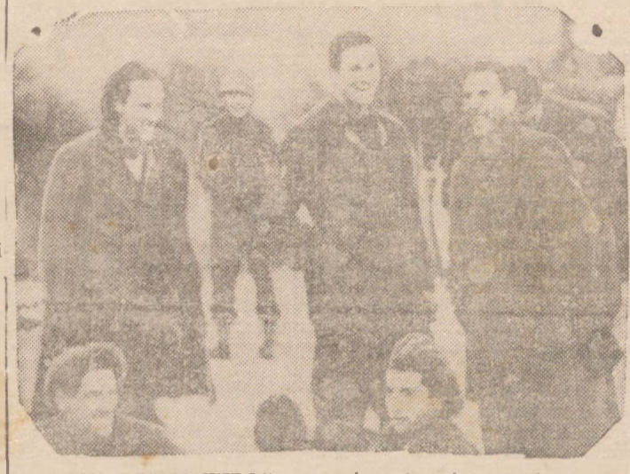
ROVENS PRISIONEIROS — Antigos fanáticos fascistas, hoje prisioneiros dos aliados na frente da Tunísia demonstram, pelo sorriso, que mais vale ser prisioneiro que escravo de um ditador caprichoso. Para estes italianos a guerra terminou. (Fot. Inter-Americana).

refugarda, afim de retardar o avanço aliado. No setor de Manchar, na zona norte da Tunísia, o 1.º Exército Imperial Britânico conseguiu avançar. Acreditase nos meios oficiais que dentro de pouco tempo os aliados chegarão a Enfidaville, importante entroncamento ferroviário das linhas que unem Kairouan e Sousse a Tunis.