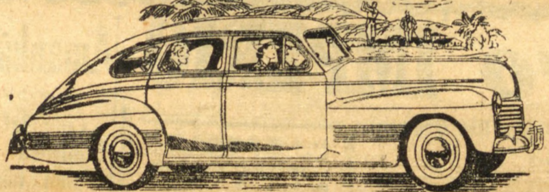
Acima ilustramos um Sport Sedan De Luxo

O luxo e o requinte do seu todo, tanto interna como externamente, satisfazem uma velha aspiração do motorista. O motor é mais potente e mais econômico. O conjunto todo, integralmente, é macio e absolutamente silencioso. Eis porque esse auto de carroceria e motor insuperáveis, que se combinam admiravelmente, que em 1940 foi um grande sucesso, em 1941 terá mais um ano memorável. Veja-o, ainda hoje. Guie-o, como si fosse seu, e torne-o seu. É UM PRODUTO DA GENERAL MOTORS