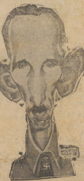
Plinio Salgado, o covarde e ambicioso politico que quasi desgraçou o paiz