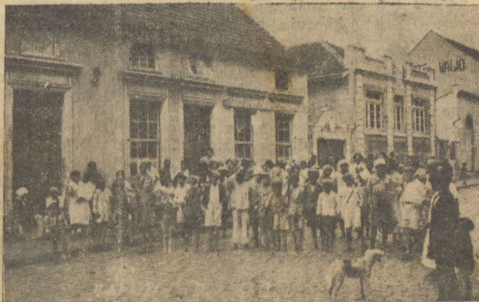
Em 1937, como soe fazer to dos os annos, o «DIARIO DOS CAMPOS» promoveu o Natal dos Pobres. O cliché representa uma das distribuições pparciais de donativos aos desfavorecidos da so rte, feitas defronte á nossa redacção