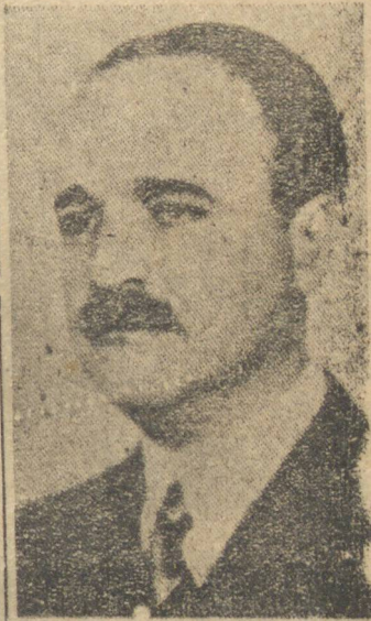
Ministro Salgado Filho