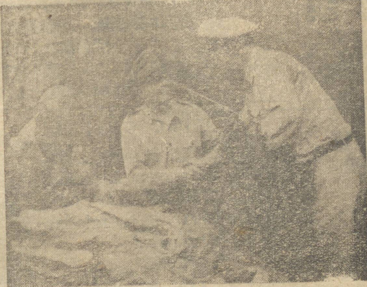
MAC ARTHUR, EM SEU QUARTEL GENERAL NO PACIFICO

"IREI BREVE A TOKIO", DIZ O GLORIOSO CABO DE GUERRA IANQUE