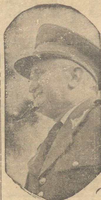
GAL. DUTRA seus contrariados, como se dá em toda a parte. O certo, porém, é que a vitória do candidato na-